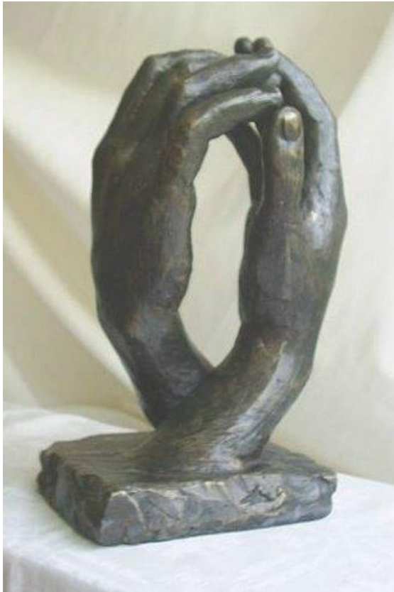
De kathedraal, Rodin